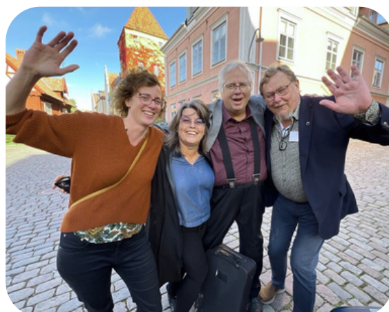
Nationella Leaderträffen i Visby

“Det är oerhört tillfredsställande att se hur relativt små summor kan skapa konkreta förbättringar i lokala miljöer och bidra till gemenskap och utveckling i våra bygder.”