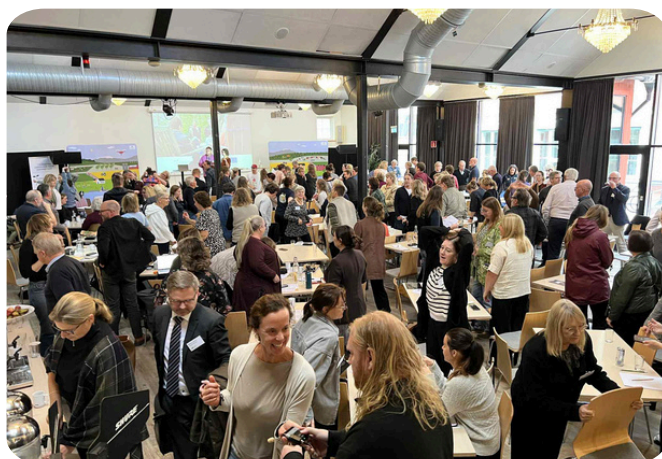
Nationella Leaderträffen i Visby

I början på året deltog vi på den regionala Leaderträffen i Östanskär/Liden, då träffades vi Leaderområden som hör till region mitt. På höstkanten medverkade vi på den årliga nationella Leaderträffen som denna gång arrangerades i Visby på Gotland. Leaderområden från hela landet träffades och tog del av seminarier, delade erfarenheter och knöt nya kontakter.