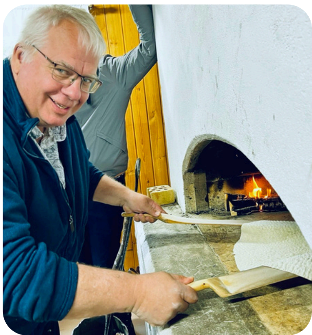
Per bakar tunnbröd i Fjällsjö hembygdsgårds nya bakugn

Under 2025 har jag på nytt fått se vilken bredd och kraft som finns i vårt Leaderområde. Från bymöten i Kullsta, Silsjönäs, Böle-Hoo, Lövvik och Utanede – där vårt beredskapsprojekt skapat värdefulla samtal om trygghet och lokal samverkan – till Europaforum Norra Sveriges möte i Bryssel där vi var representerade i diskussioner av strategisk betydelse för hela norra Sverige. Leader 3sam har varit närvarande både i det lokala vardagsarbetet och i de större sammanhang där framtida förutsättningar formas.